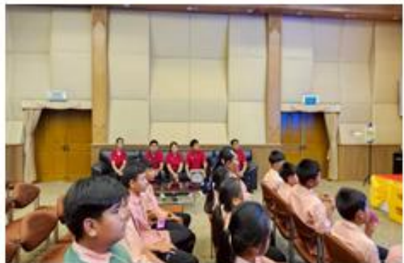
- วัดพระบาทภูพานคำ